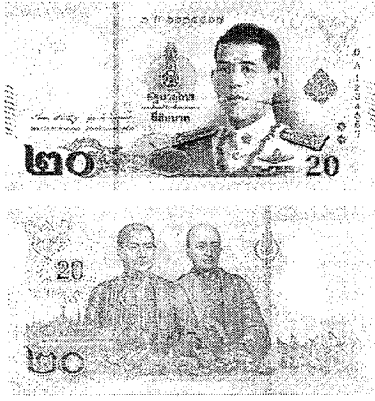
ธนบัตรพอลิเมอร์ ชนิดราคา 20 บาท